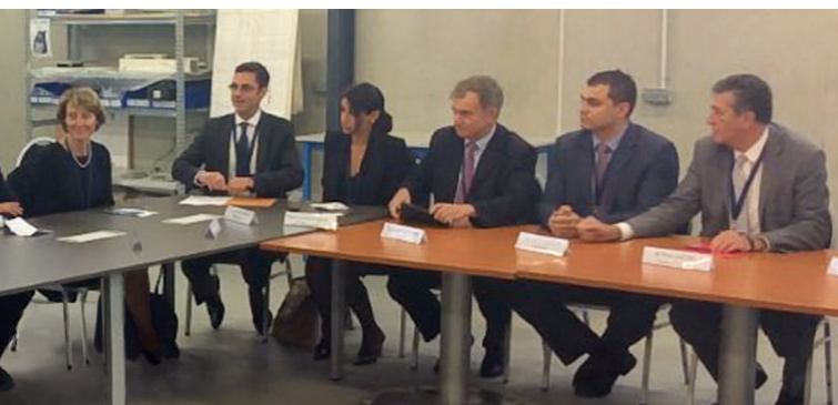
Le premier ministre Manuel Valls en visite sur le site de Finaero à Blagnac

► Un groupe porté par la forte dynamique de son équipe dirigeante, emmenée par Christophe Cador, avec une croissance organique annuelle de 7% et une stratégie ambitieuse.